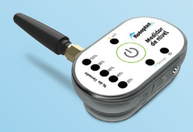
Monitor de nivel